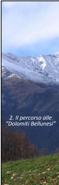
2. Il percorso alle "Dolomiti Bellunesi"