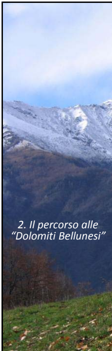
2. Il percorso alle "Dolomiti Bellunesi"