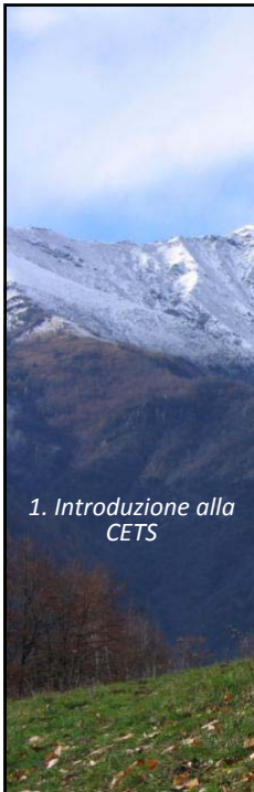
1. Introduzione alla CETS