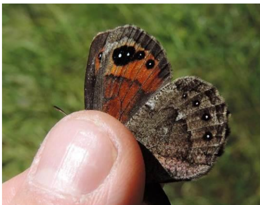
Esempio di fotografia ottimale: ali anteriore e posteriore, da sotto

Nel caso di “cattura temporanea”, suggeriamo di trattenere il corpo della farfalla e distendere le ali come illustrato nelle fotografie sottostanti, avendo cura di impedire il movimento delle ali ma, allo stesso tempo, coprendo con le dita il meno possibile la parte basale delle ali.