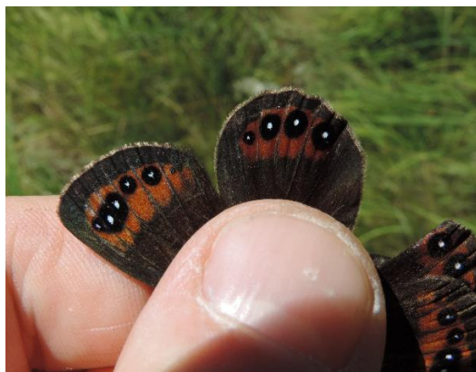
Esempio di fotografia ottimale: ali anteriore e posteriore, da sopra